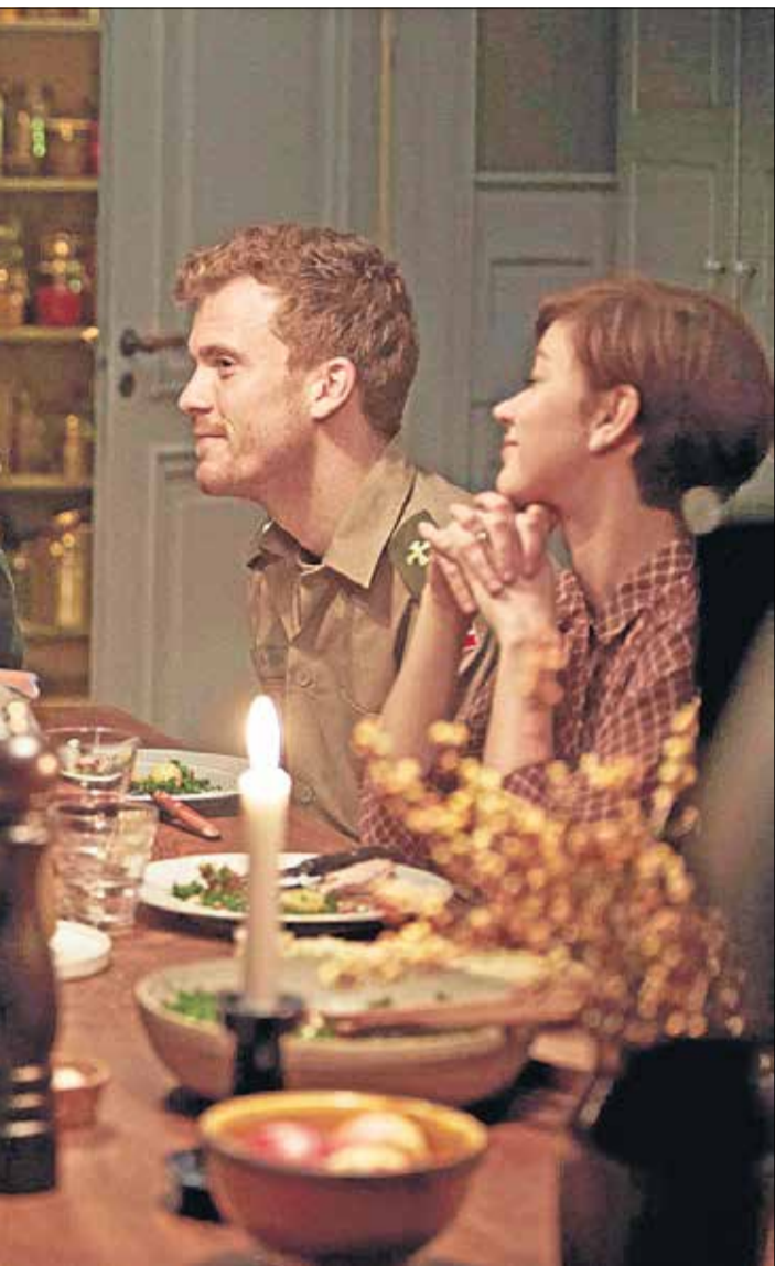
August er hjemme fra krigen. Familien samles. Alt er lykke. Men kun på overfladen. For August har fået dæmoner med i bagagen fra Afghanistan. Og præstefar Johannes sidder og skåler i dansk-vand.