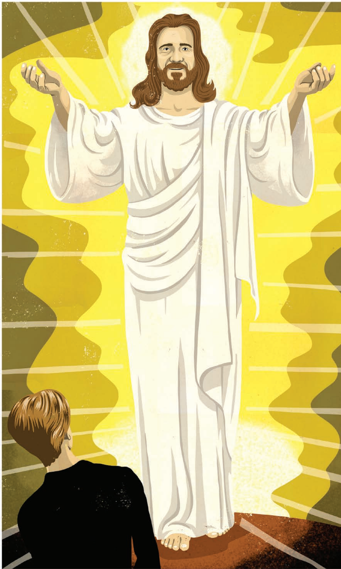
ILLUSTRATION: RASMUS JUUL

Personligt synes jeg, det kunne være dejligt, hvis jeg havde kunnet nøjes med at bruge mit hoved i den her sammenhæng, som jeg altid har gjort. Jeg har været vant til læringsprocesser, hvor jeg selv kunne være med og gå langs min viden, og det har været vildt provokerende for mig at få smidt en masse viden ind i mig, som jeg slet ikke havde kontrol over. Det var nemmere dengang, hvor jeg vidste, jeg selv havde kontrol over, hvad der blev hørdt ind i mit hoved og ind i min vidensbank.