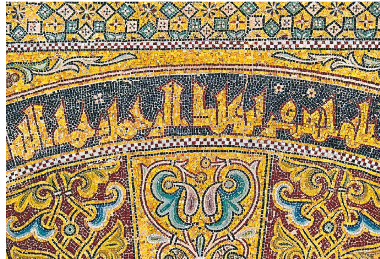
Inderst i mezquitaen er nichen, mihrab, der peger mod Mekka. Væggene er dækket af mosaikker sat af kristne håndværkere som gave til kalif Al-Hakam fra den romerske kejser Nicephoros Phocas.