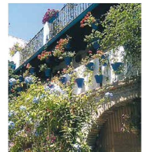
Inde i enhver gårdhave bugner blomsterne.