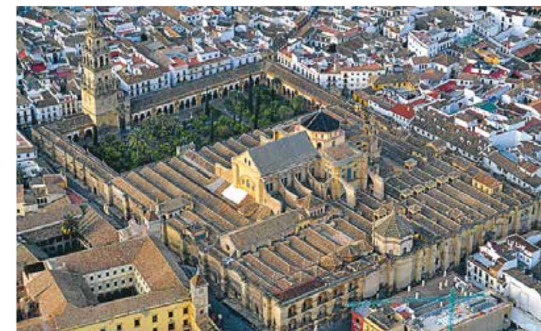
Mezquitaen i Córdoba er som en by i byen.