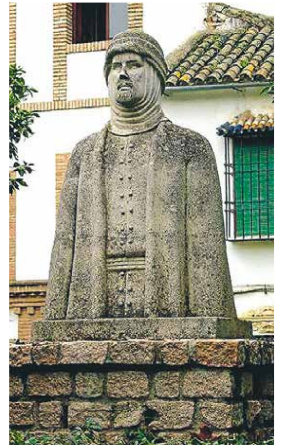
Al-Hakam regerede i Córdoba frem til 976, udvidede moskéen og udbredte viden og kundskab på tværs af lande og kulturer, så religionerne kunne eksistere side om side.

Af Charlotte Rørth charlotte.roerth@nordjyske.dk