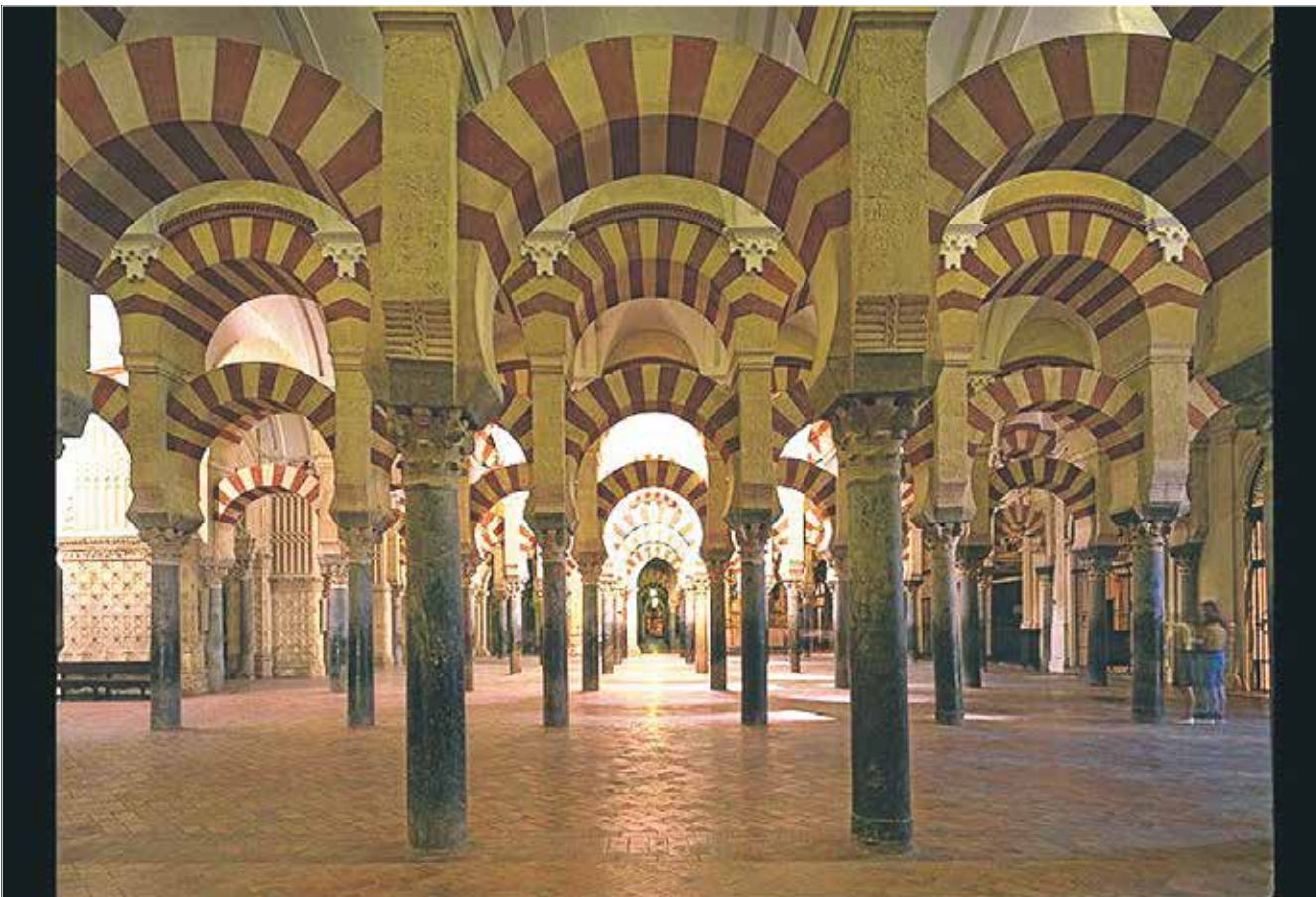
De 856 søjler af mange slags marmor i moskéen i Córdoba er som en tryk skov at gå i.

Hvordan en moské i Córdoba vækker ukendte historiske sammenhænge