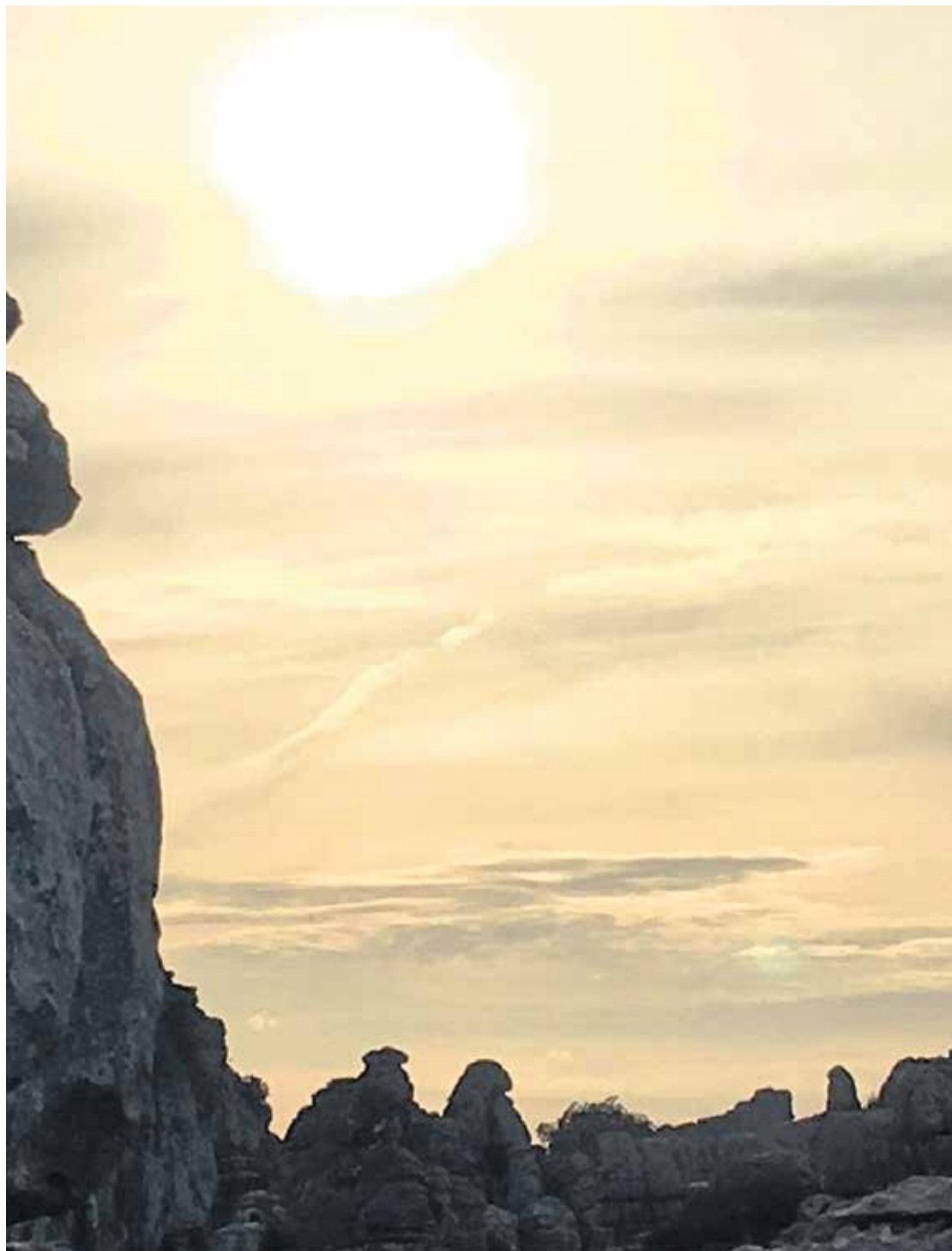
En vandretur oppe i El Torcal er som at forsvinde i et forhistorisk og mytisk landskab, hvor sten ligner skildpadder, kvinder og ryttere.

8000 år gammel Venus-amulet og en britisk lady har givet nyt liv til spansk forhistorie