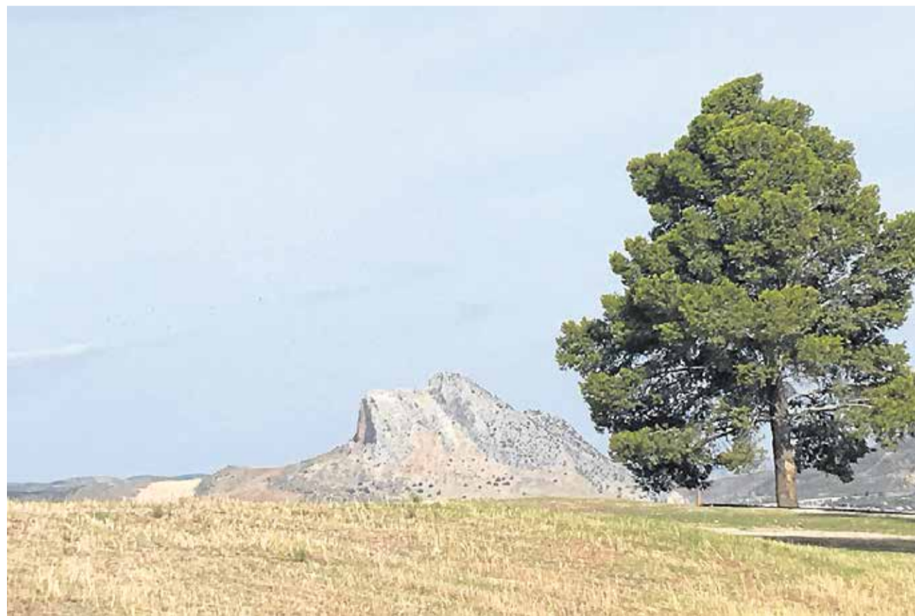
Manden, der ligger ned, er et bjerg, spanierne senere har døbt de forelskedes bjerg, Peña de los Enamorados. Måske er det årsagen til, at Antequera er et af de første steder, mennesker byggede helligdomme i Spanien.