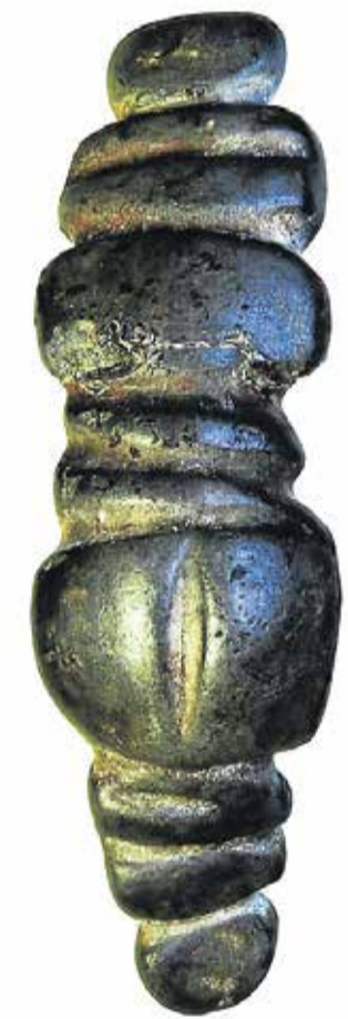
Hun er kun 4,8 centimeter, men har haft stor betydning, da hun blev skabt for 8000 år siden.

Tekst og foto: Charlotte Rørth charlotte.roerth@nordjyske.dk