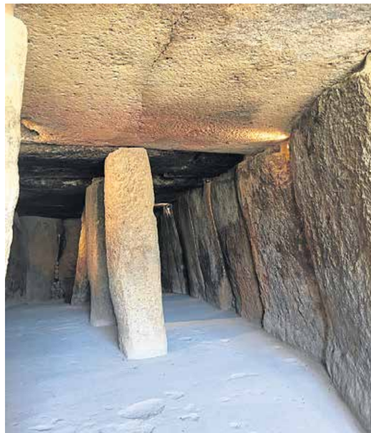
Den største sten vejer 180 ton, og dyssen er 30 meter dyb. Det gør den til den største i Europa.

Lige som i England er der i Antequera flere monumenter, der hænger sammen med hinanden. Romeral er rund som ved Middelhavet. Menga og Viera er aflange som