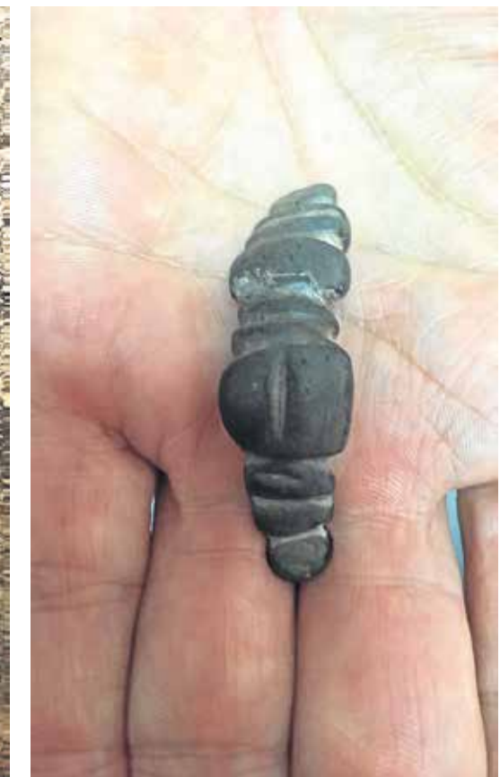
Hvad mon hun har haft af magt, den lille Venus fra Antequera?