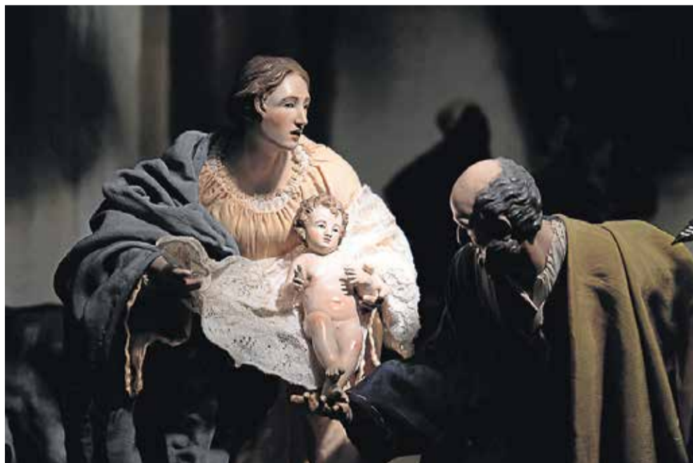
Krybbespil fås i mange stilarter og fortæller mange forskellige historier fra fattigdom på landet til fine klæder til ære for det nyfødte barn som her på Carmen Thyssen-museets krybbespil i foyeren.