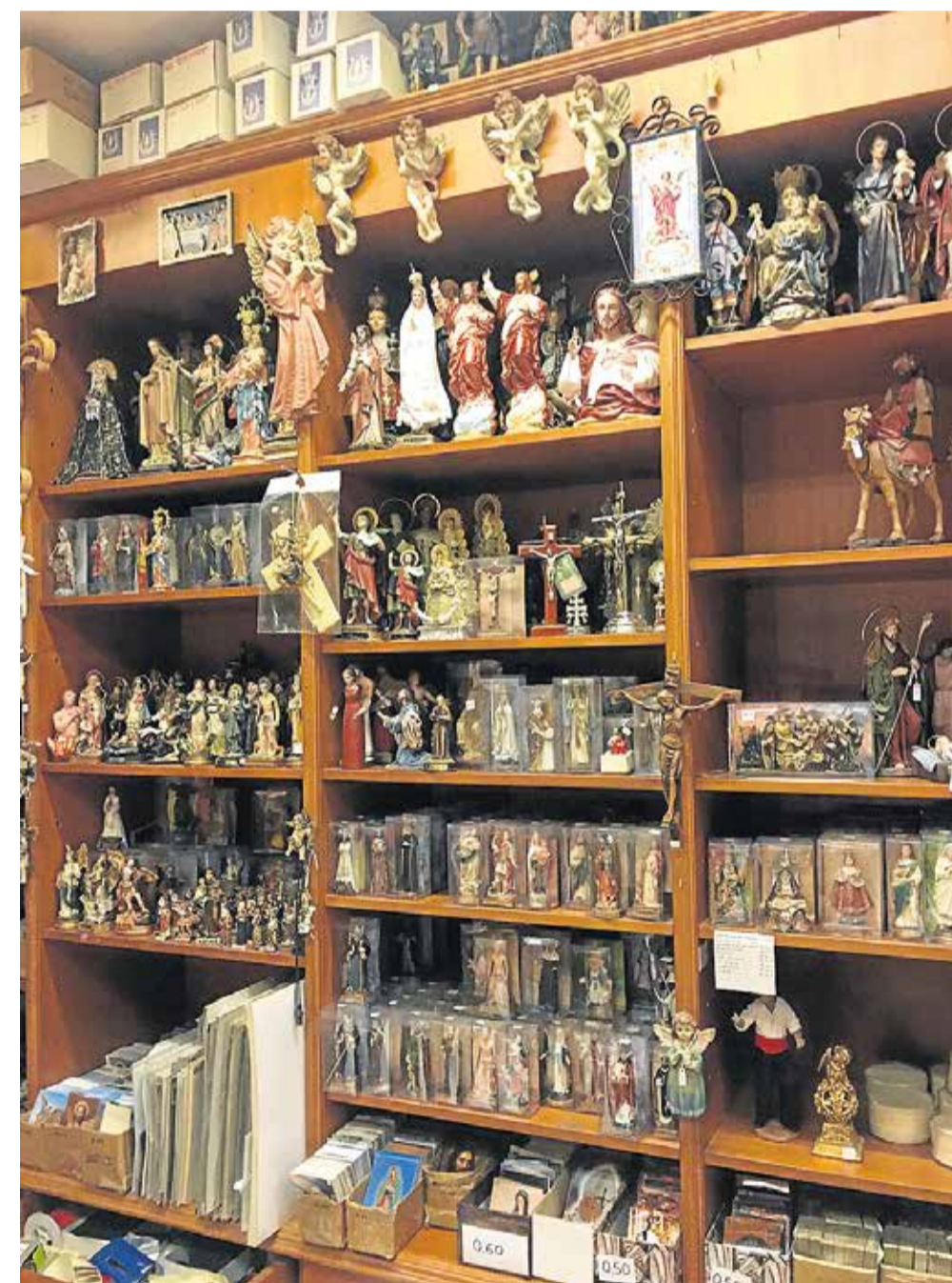
Helgener, hellige kameler, kors og engle. Alt til faget hørende sælges hos Nazareno.