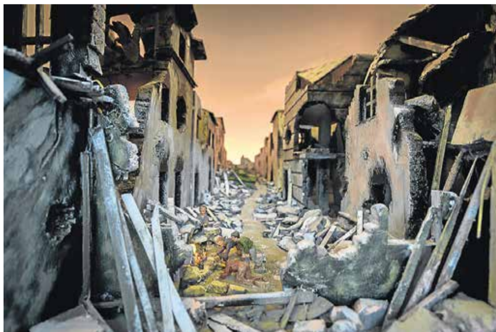
Sorg og afmagt og to børn, der ser på en nyfødt baby. Julekrybber anno 2017 afspejler virkeligheden for de flygtende.

- Det skaber glæde. Og det er vel det, julen handler om, ikke?